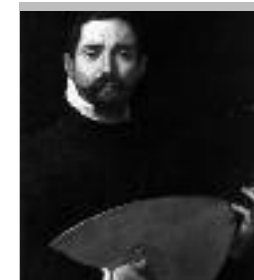
Giovanni Gabrieli (geb. 1557 in Venedig) studierte bei seinem Onkel, dem Komponisten Andrea Gabrieli und bei Orlando di Lasso während dessen Zeit in München.