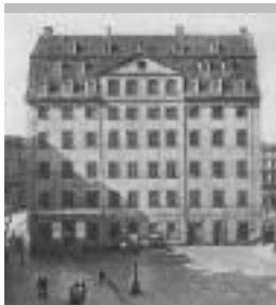
Ein Bild der Thomaschule in Leipzig (1896). Bach leitete den Thomanerchor von 1723 bis zu seinem Tod. Seine Familie wohnte im linken Drittel des Hauses

Jene intensive Auseinandersetzung lässt sich bereits bei Arnold Schönberg (1874 bis 1951), dem Lehrer Weberns, finden. Dieser bezeichnete Bach scherzhaft als den ersten Zwölftonkomponisten und sah in dessen