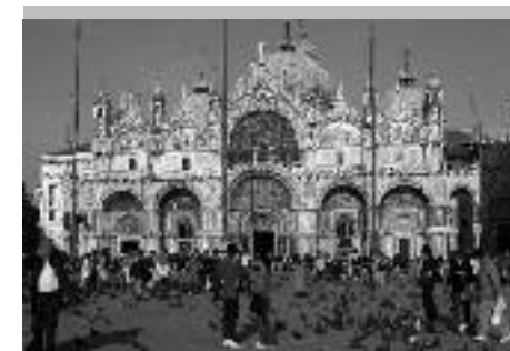
1584 oder 1585 wurde Giovanni Gabrieli 2. Organist in San Marco. Nach dem Tod seines Onkels, 1586, Komponist und Hauptorganist.