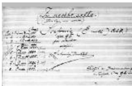
Titelblatt der Sinfonie aus der Neuen Welt: Die Weltpremiere fand am 16. Dezember 1893 in der Carnegie Hall in New York statt.

Als Dvořáks 9. Sinfonie 1893 unter der Leitung von Anton Seidl uraufgeführt wurde, sahen die Amerikaner damit den Beweis erbracht, dass auf der Grundlage amerikanischer Folklore eine eigenständige nationale Musik entstehen konnte. Doch in der Folge wurden heftige Debatten darüber geführt, welche Teile der Sinfonie tatsächlich als amerikanisch betrachtet werden konnten. So wurden die leittonarmen modalen Leitern, die der Komponist als typisch für die Melodik der Schwarzen und der Indianer beschrieb, beispielsweise auch von Mendelssohn in seinen Hebriden und von Verdi in Aida verwendet – worauf Dvořák selbst jedoch hinwies.