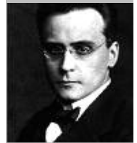
Anton Webern (geb. 1883 in Wien, gest. 1945 in Mittersill). Seine Mutter erteilte ihm sehr früh Klavierunterricht. Dieses Foto entstand 1912 in Stettin.