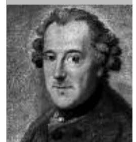
Friedrich II., auch Friedrich der Große, oder Der Alte Fritz (geb. 1712 in Berlin, gest. 1786 in Potsdam), war selbst hervorragender Musiker und Komponist.