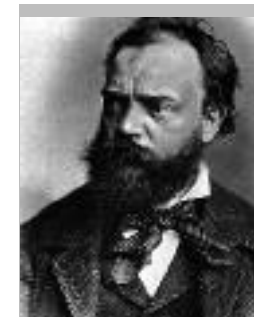
Antonín Leopold Dvořák (geb. am 8. September 1841 in Nelahozeves, gest. am 1. Mai 1904 in Prag). Seine Karriere begann als Kaffeehausmusiker, wo er als Bratschist in einem privaten Orchester spielte.

Dvořáks 9. Sinfonie zählt heute zu den meistaufgeführten klassischen Werken.