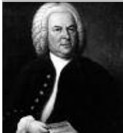
Johann S. Bach (geb. 1685 in Eisenach, gest. 1750 in Leipzig): einer der bedeutendsten deutschen Komponisten sowie Orgel- und Klaviervirtuose des Barock.